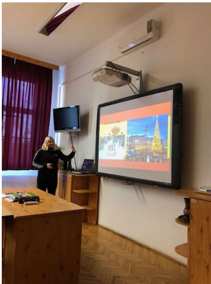
Európa országainak karácsonya kiselőadás