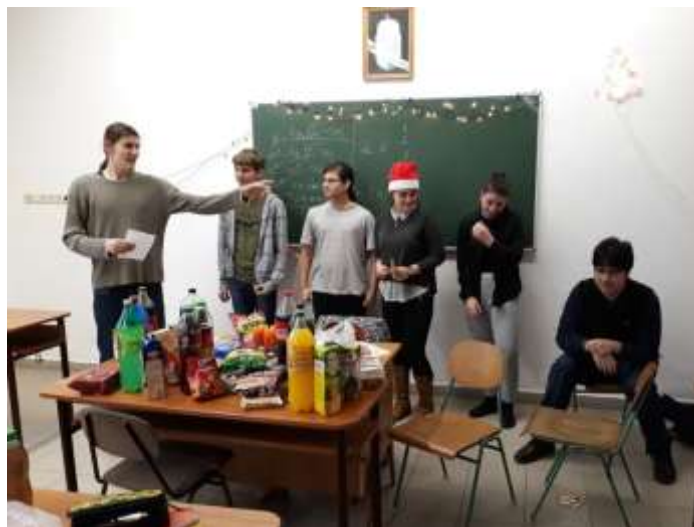
Beugró az Európai Unióba