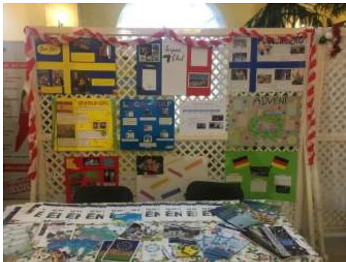
Európai Unió országainak karácsonya tablókon