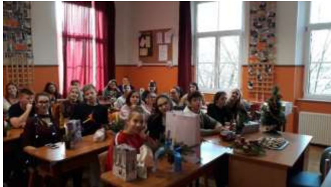
Európai színei – karácsonyi díszek készítői