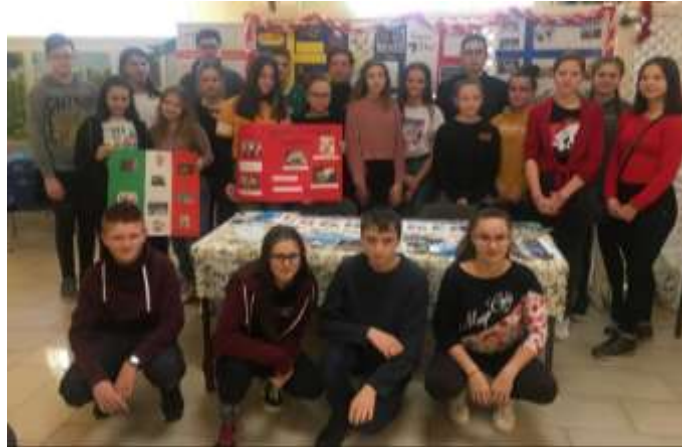
Karácsonyi tablók készítői