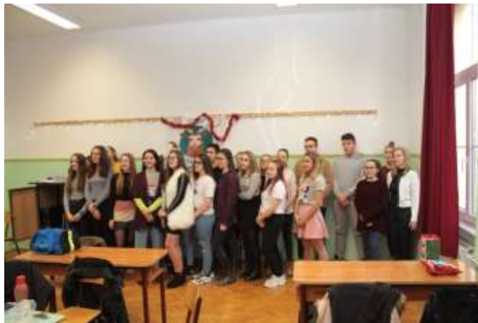
Európai karácsonyi énekek