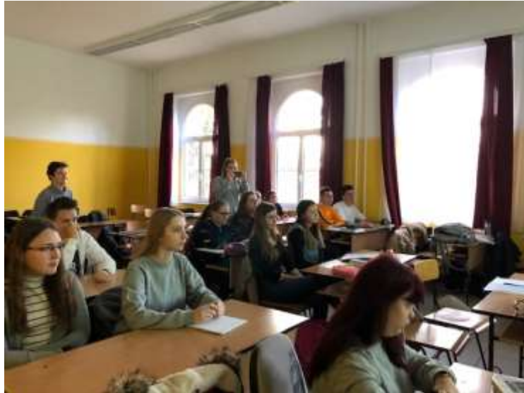
Európai Unió karácsonya kiselőadás